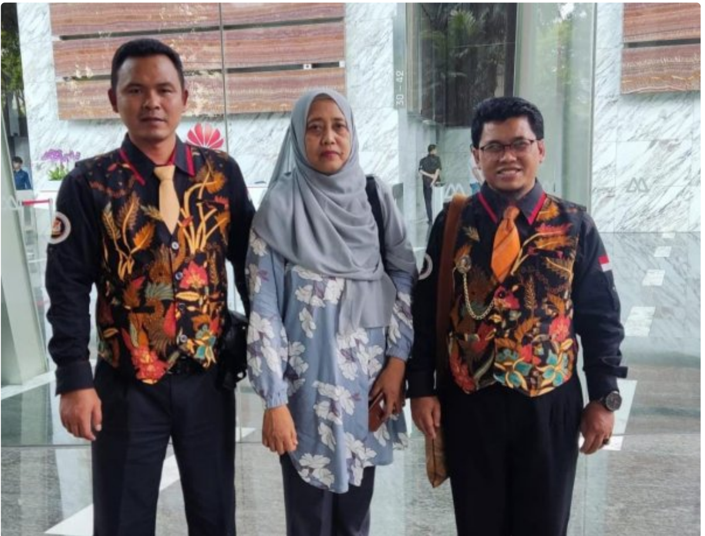
Foto: Tim LIDIK KRIMSUS RI melaporkan dugaan penyimpangan ini ke Komisi Pemberantasan Korupsi (KPK) dan Otoritas Jasa Keuangan (OJK), menuding adanya praktik kotor yang dilakukan oknum PT. Bank Negara Indonesia (Persero) Tbk di Kota Semarang. Senin (04/11/2024).

JAKARTA- Tim Divisi Hukum Lembaga Informasi Data Investigasi Korupsi dan